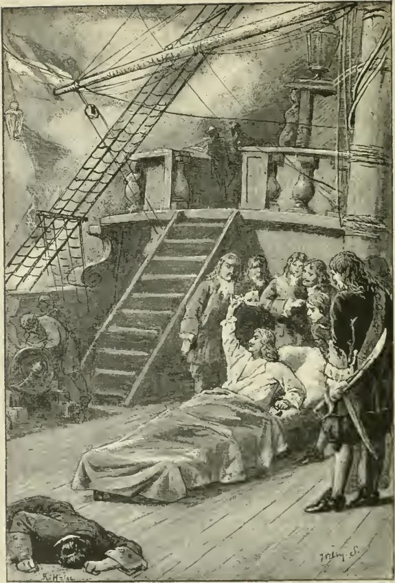
Pag. 255 bleef hij zijne bevelen geven en zijne manschappen aanmoedigen.